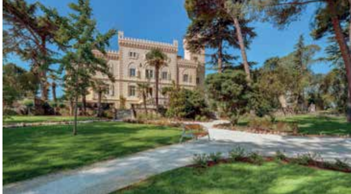
Valamar Collection Isabella Island Resort

malim dvorcem | 28 | koji je 1886. godine dao sagraditi markiz Benedetto Polesini.